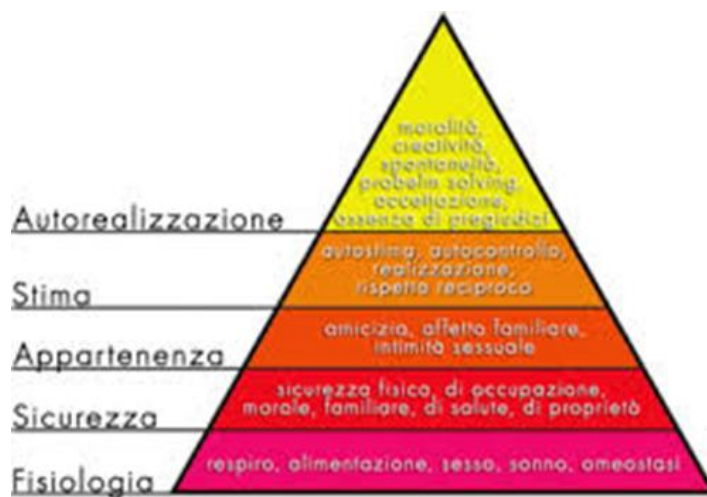
La piramide dei bisogni di Maslow (1954)

analizzando la personale capacità di soddisfare i propri bisogni e, in base a questi, di saper comprendere quelle che sono anche le necessità dell'altro. Dunque partendo dal basso troviamo: i bisogni