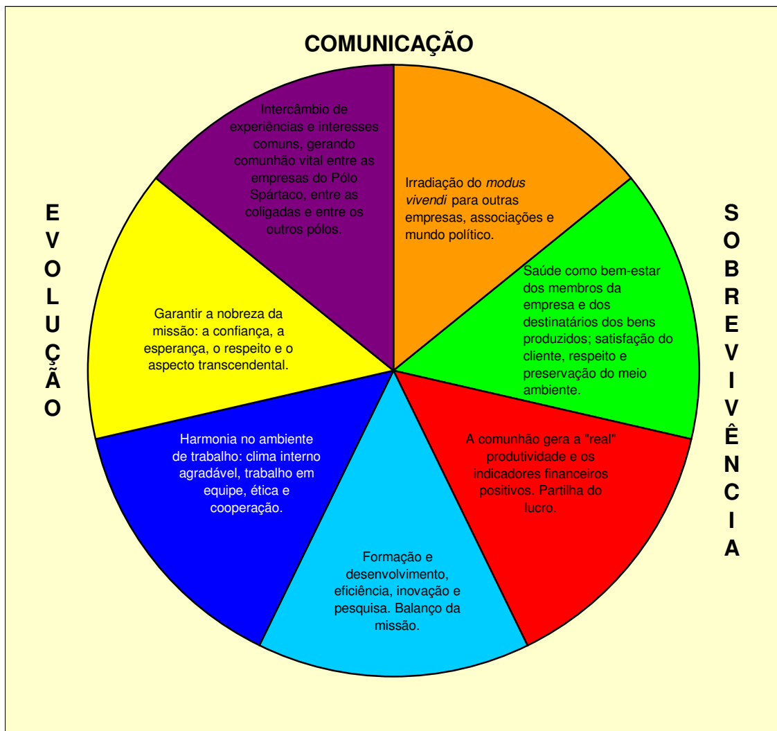
Figura 3 – Perspectivas de comunicação, evolução e sobrevivência das empresas da EdC

Fonte: LEIBHOLZ, Rodolfo. Projeto ESPRI 2010 In: CONGRESSO NACIONAL DA ECONOMIA DE COMUNHÃO, 2002, Vargem Grande Paulista. Anais... Vargem Grande Paulista: Centro Mariápolis Ginetta, 2002, p. 31.